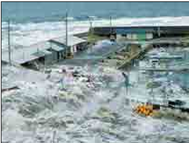
東日本大震災は「 津波 」