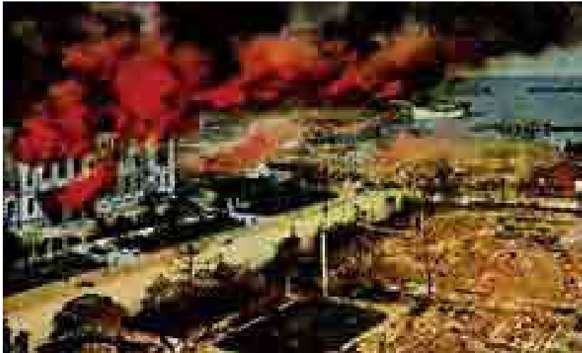
関東大震災は「 火災 」