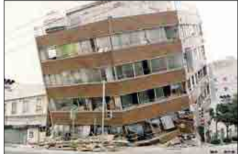
阪神・淡路大震災は「 倒壊・家具の転倒 」