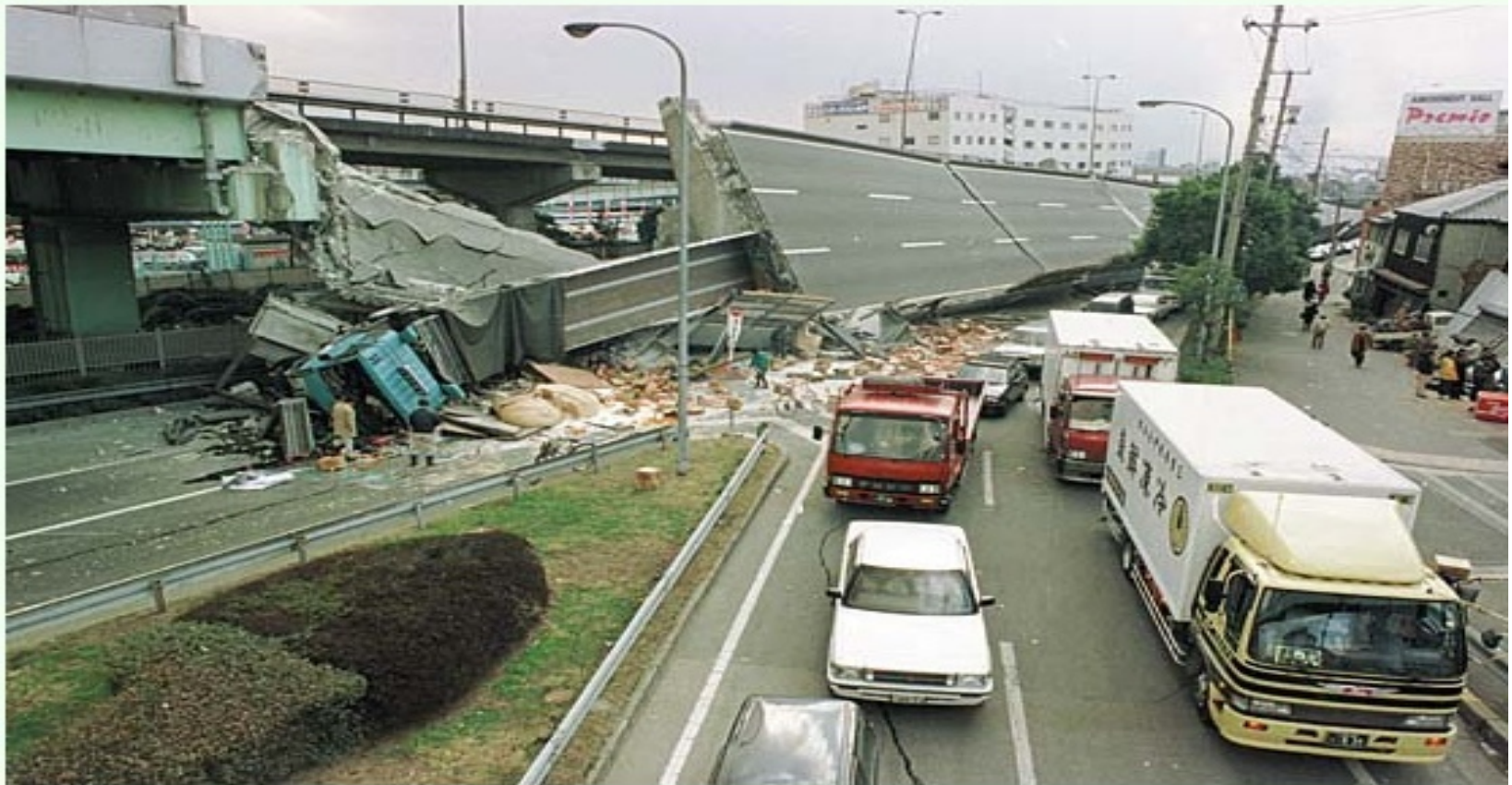
No.11 崩れた国道43号岩屋高架橋から落ちたトラック。