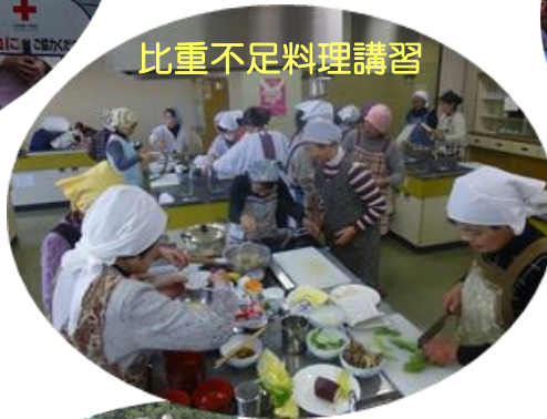
比重不足料理講習