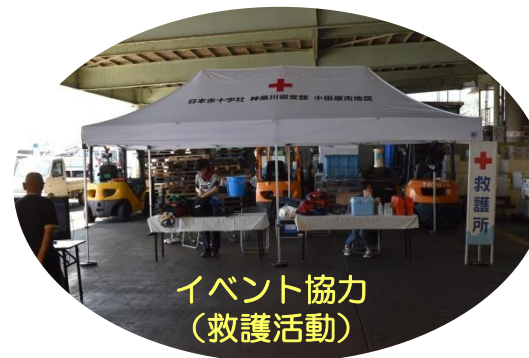
イベント協力 (救護活動)