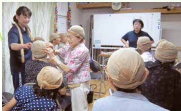
町内会館で実施された救急法の講習会

川崎市が実施する防災訓練への参加、 町内会・自治会が行う 応急手当等の講習会への協力。