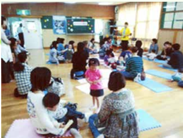
子育て世代を対象に幼児安全法講習会を開催

事故の予防や応急手当等、 日常生活に役立つ知識や技術、 考え方を学ぶ講習会を主催しています。