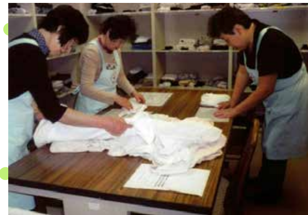
老人ホームでの奉仕活動は、平成17年から実施