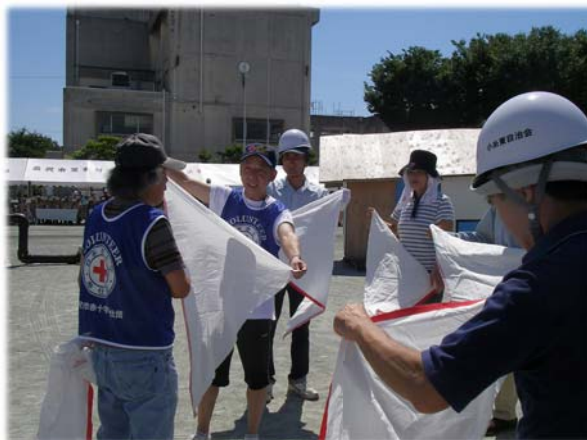
【地域の皆さんへ応急手当の展示指導】