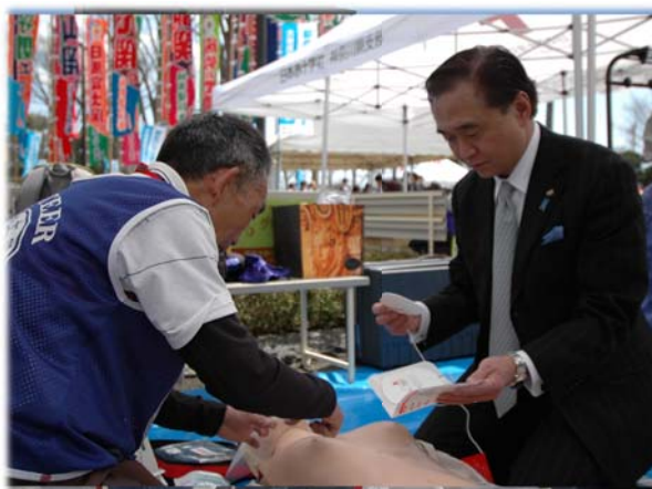
【日赤神奈川県支部長も訓練です】