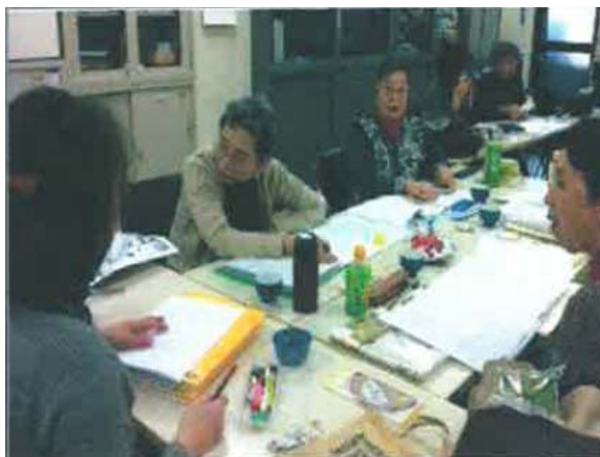
「絵本点字訳指導の話し合い」