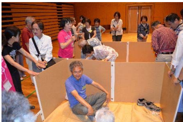
(二者懇談会 一視障者と防災研修会)