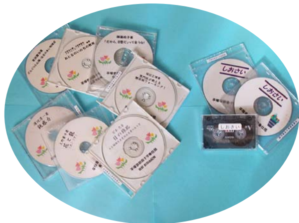
デージー図書と音訳機関紙「しおさい」

私達は視覚に障がいのある方々のために 文字情報や写真・図などを 音声に変えて提供（音訳）しています