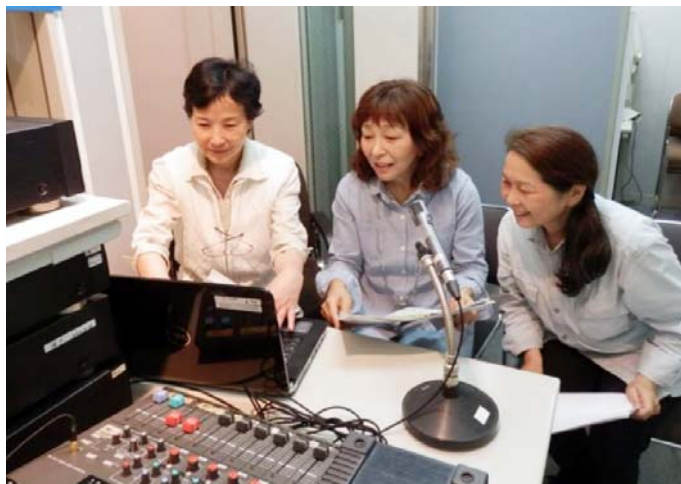
保健福祉センター3F 録音室での活動風景