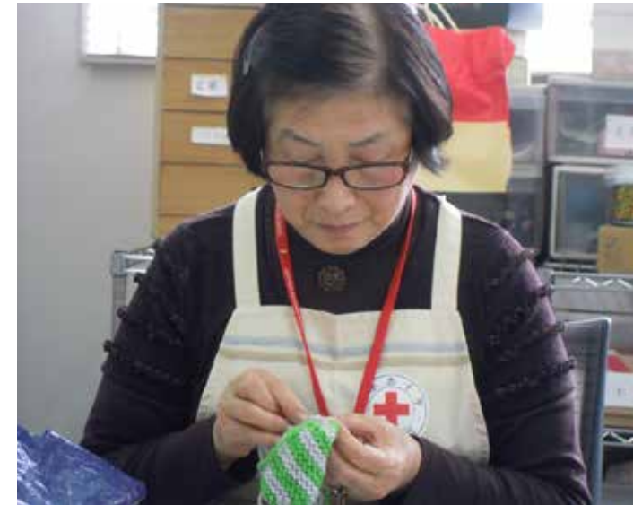
( 活動中の様子 )