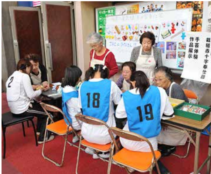
( 救急法競技会時の様子 )