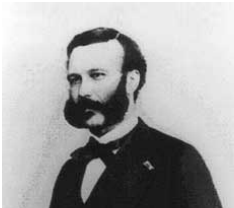
赤十字の創設者 アンリー・デュナン